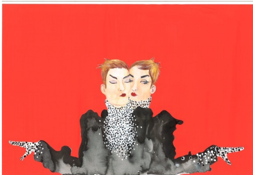
Illustration de Marc Salvan-Guillotin

Samedi 20 juin - salle des Actes de la Sorbonne (Paris)